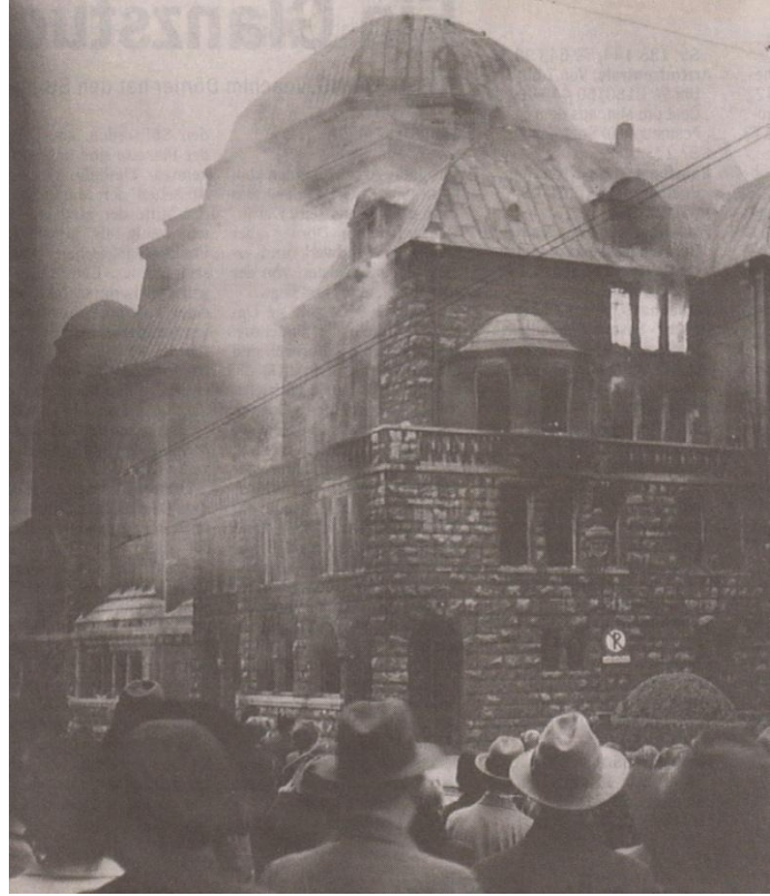
Brennende Synagoge in der Steeler Straße

Vor 78 Jahren, in der Nacht vom 9. auf den 10. November brannten in ganz Deutschland die Synagogen. Jüdische Geschäfte und Wohnungen wurden geplündert, zertrümmert, Menschen zusammengeschlagen, verhaftet, in Konzentrationslager verschleppt, ermordet. Auch in Essen wütete am 9. November 1938 der nackte Terror des faschistischen Regimes. Er war ein grausamer Auftakt hin zur industriell organisierten Vernichtung von Juden, Sinti und Roma in den Gaskammern von Auschwitz und vielen anderen Konzentrationslagern.